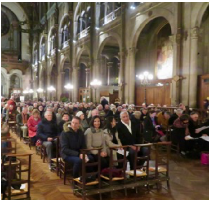
Misa del 8 de diciembre en la iglesia de San Agustín de París.